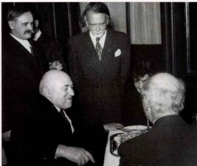
Veres Péter és Kodály Zoltán Rákosival

A Baumgarten felszámolásával szinte egy időben a kormány Kossuth-díj néven állami kitüntetést alapított. S hogy egyértelmű legyen, ki az úr a háznál, a díjat nem Dinnyés miniszterelnök adta át, hanem maga Rákosi Mátyás. Az első évben nívós alkotókat jutalmaztak. A vezérdíjazott az új rendszer szakrális alakja, Kodály Zoltán volt, aki később megkapta az úgynevezett „Nagy Kossuthot” is, a csúcskitüntetést. 1949