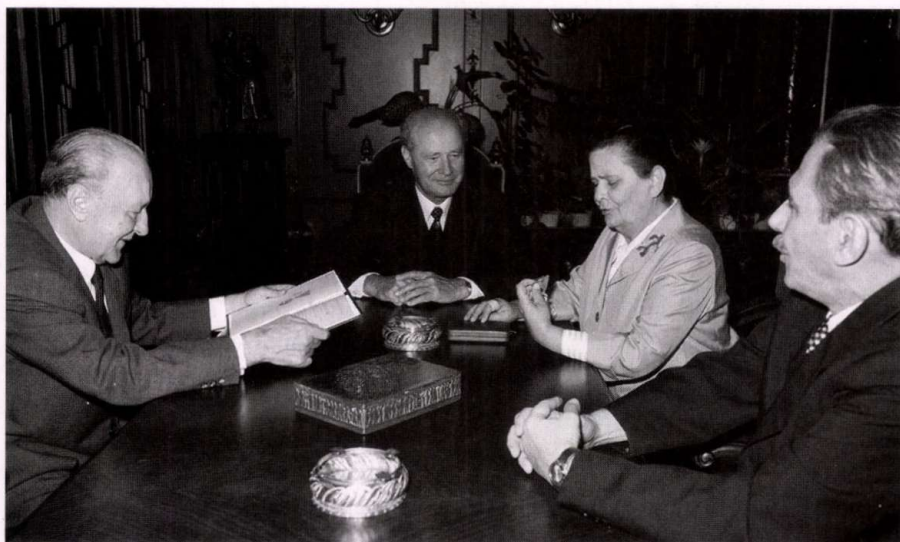
A kupaktanács: Kádár és felesége, Losonczy, Aczél

– A háború előtt – mondja nosztalgikusan Pomogáts Béla – ez fejedelmi jutalom volt. A nagydíj összege – háromezer pengő – a harmincas évek elején egy ház árával felért. Az ezer-