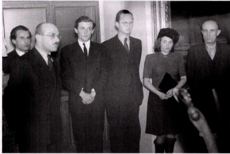
Pilinszky János (balról a harmadik) a Baumgarten-díj átadásakor (1947)